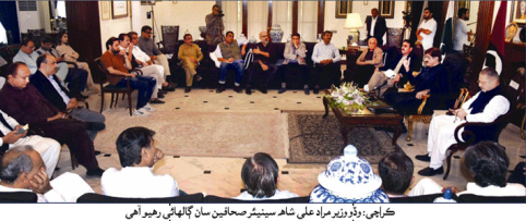
ڪراچي، رڳو وزير رندا علي شاهه سينيٽر سنجي ڪار سان ڳالهائي رهيو آهي

نورجهان اعواڻ جو قتل ڪيس داخل، مٿس ۽ ڏير گرفتار ميتولا جي والد علي شير عرف حاجن ڪلهوڙي ڪيس ڪرايو